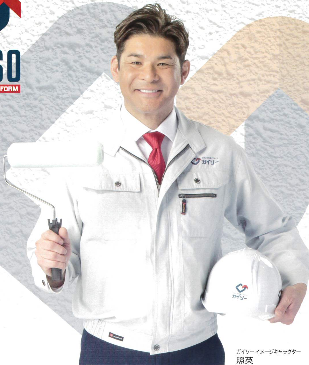
ガイソーイメージキャラクター 照英